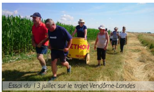
Essai du 13 juillet sur le trajet Vendôme-Landes

Le samedi 7 décembre , dès potron-minet, 400 marcheurs s'élanceront pour un relais de chars gaulois sur la voie romaine n°11 relayant Blois à Vendôme.